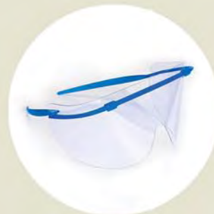
¡Es así de fácil!