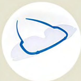
Plano, ya ensamblado y listo para usar